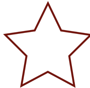
Abbildung 2 Stern