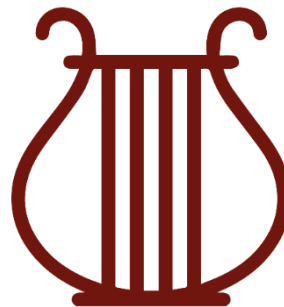
Abbildung 4 Lyra