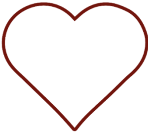
Abbildung 1 Herz