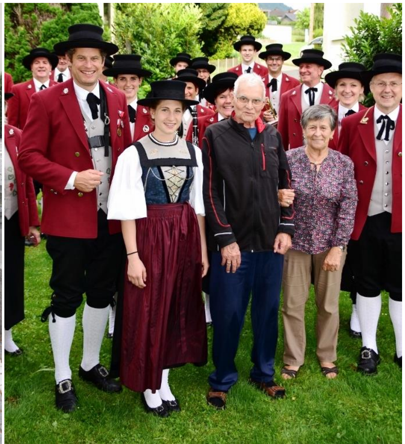
Musikalische Gratulation von der SHM Nüziders