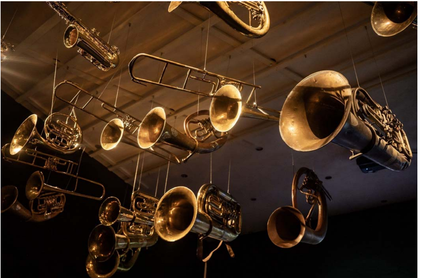
Von der Decke hängen Klarinetten, Saxophone und Trompeten. daniel furxer

Beim Betreten der Ausstellung hängen Klarinetten, Saxophone oder Trompeten von der Decke, die auf den eintretenden Besucher gerichtet sind, dahinter, auf einen Perlenvorhang projiziert, marschiert eine Blaskapelle kurz und laut auf die Besucher zu.