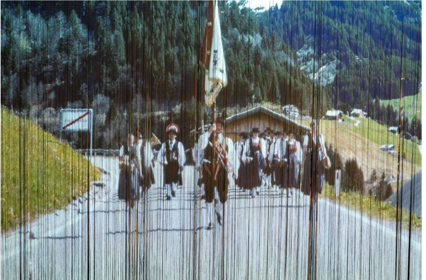
Auf einem Perlenvorhang projiziert marschiert eine Blaskapelle auf die Besucher zu. daniel furxer

Beim Betreten der Ausstellung hängen Klarinetten, Saxophone oder Trompeten von der Decke, die auf den eintretenden Besucher gerichtet sind, dahinter, auf einen Perlenvorhang projiziert, marschiert eine Blaskapelle kurz und laut auf die Besucher zu.